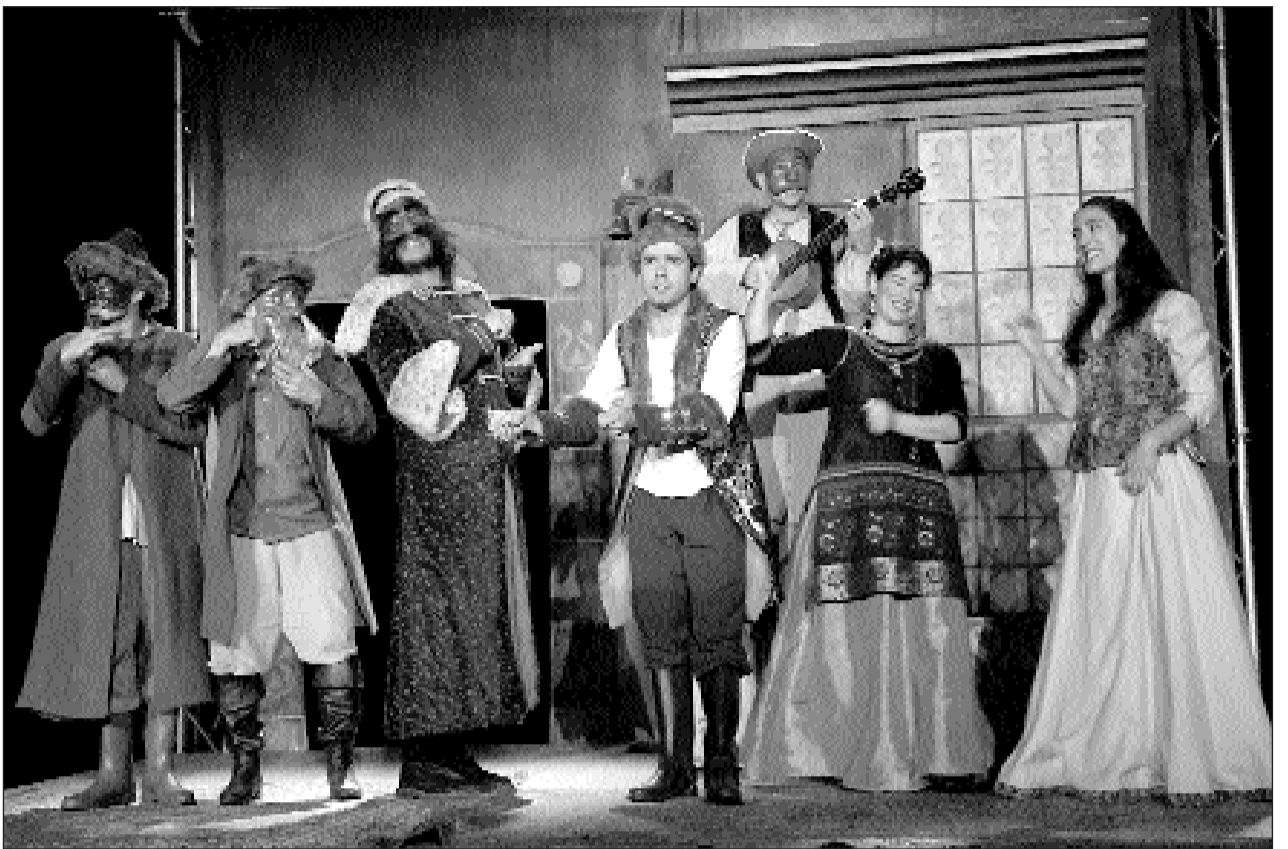
Une création vivifiante, tonifiante et enjouée : le Révizor. (Crédit photo : Vincent Jolfre).

La dernière représentation du Révizor est jouée lundi soir. Après quoi, le rideau des Théâtrales retombera sur le site majestueux du premier château de la Loire.