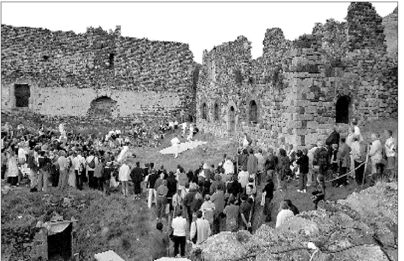
La représentation de l'atelier théâtre marquait le début d'une belle soirée avec un public conquis.